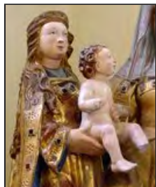
Détail de la photo de la page 28

Marie et Jean-Baptiste sont fêtés par l'Église le jour de leur naissance et non de leur mort, comme les autres saints et saintes. C'est qu'ils sont les seuls à avoir eu une naissance miraculeuse.