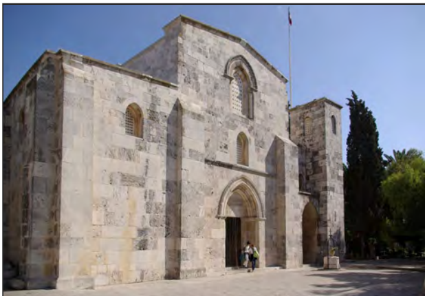
Statue de sainte Anne Trinitaire à Becco – Église Sainte-Anne de Jérusalem (p.5)