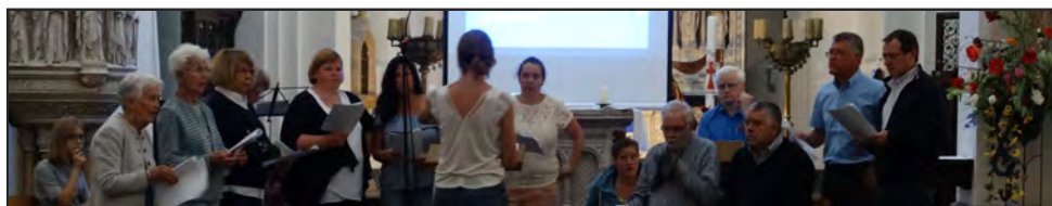
Spa - 23 juin - Concert de l'ensemble vocal Notre-Dame des Sources